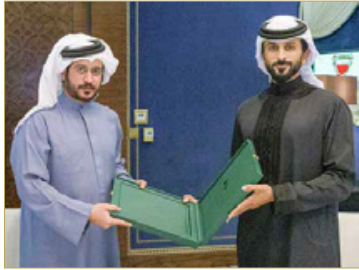
سمو الشيخ ناصر بن حمد يتسلم التقرير من سمو الشيخ خالد بن حمد

جاء سمو الشيخ ناصر بن حمد آل خليفة ممثل جلالته الملك الأعمال الإنسانية وشؤون الشباب تقديم عظيم الشكر والامتنان إلى مقام حضرة صاحب الجلالة الملك حمد بن عيسى آل خليفة، عاهل البلاد المفدى، بمناسبة إطلاق جلالاته مسمى 'عام الشباب البحريني' على العام الحالي 2022، جاء ذلك في مستهل اجتماع المجلس الأعلى للشباب والرياضة الذي عقد برئاسة سموه وحضور سمو الشيخ خالد بن حمد آل خليفة النائب الأول لرئيس المجلس الأعلى للشباب والرياضة رئيس الهيئة العامة للرياضة رئيس اللجنة الأولمبية البحرينية، وأصحاب السمو والمعالى والسعادة أعضاء المجلس.