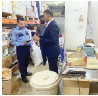
والمتجارة، تم التحفظ على المواد الغذائية لحين استكمال الإجراءات القانونية والإدارية.

ضبط قسم مراقبة الأغذية بإدارة الصحة العامة أمس مخزناً يقوم بتعبئة مواد غذائية وتغيير تواريخ صلاحيتها من غير ترخيص تجاري، وذلك بالتعاون والتنسيق المشترك مع وزارة التجارة، حيث تم غلق المكان غلقاً إدارياً.